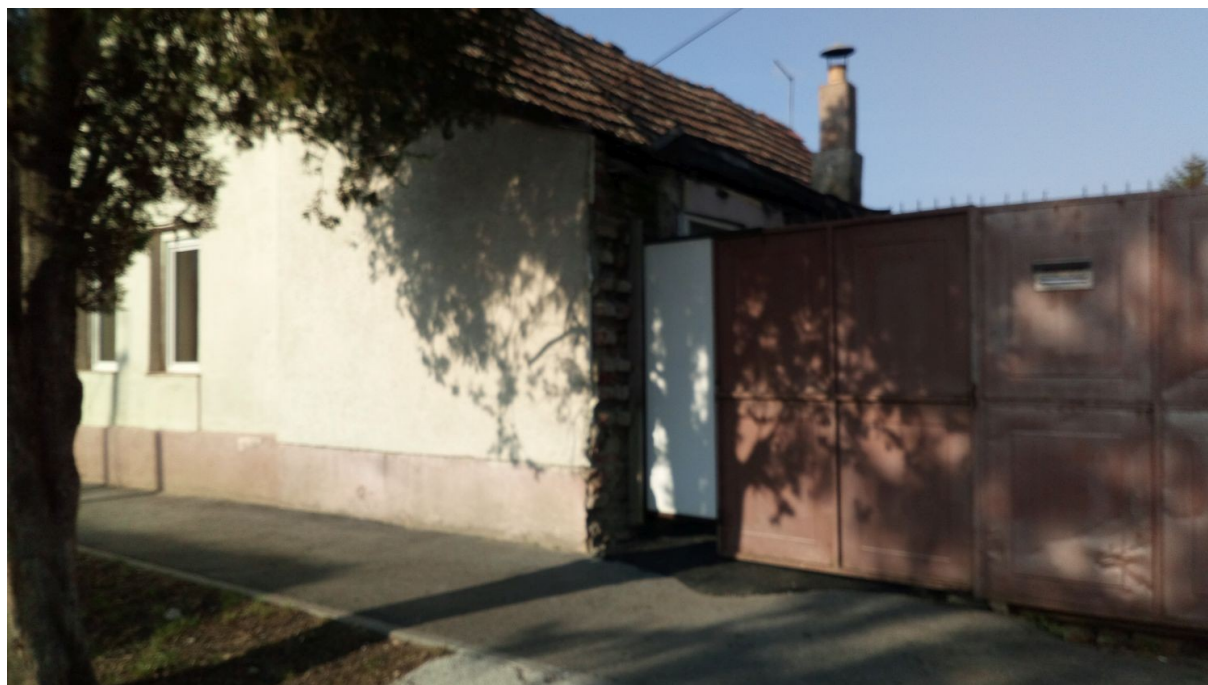
Slika 1. Mije Kišpatića 79 - Osijek

Stupljeno je u kontakt s g. Miroslavom Musićem koji daje iskaz kako radi u Dubrovniku, spreman na suradnju, za Helion grupu pretpostavlja da su platili potraživanje u iznosu od 18,000 kn (stavka potraživanja od kupaca), pozajmice prema članu društva 61,800 spreman otplaćivati, od imovine ima samo računalna oprema u knjigovodstvenom iznosu vrijednosti 6,924 kn, obaviješten o prethodnom postupku i poslan mu je dopis na privatnu elektroničku poštu. Adresa sjedišta dužnika Mije Kišpatića 79, Osijek je fizički pohođena i prikazana na slici 1. Radi se o privatnoj kući gdje nitko nije zatečen.